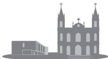
Paróquia de Castelões de Cepeda